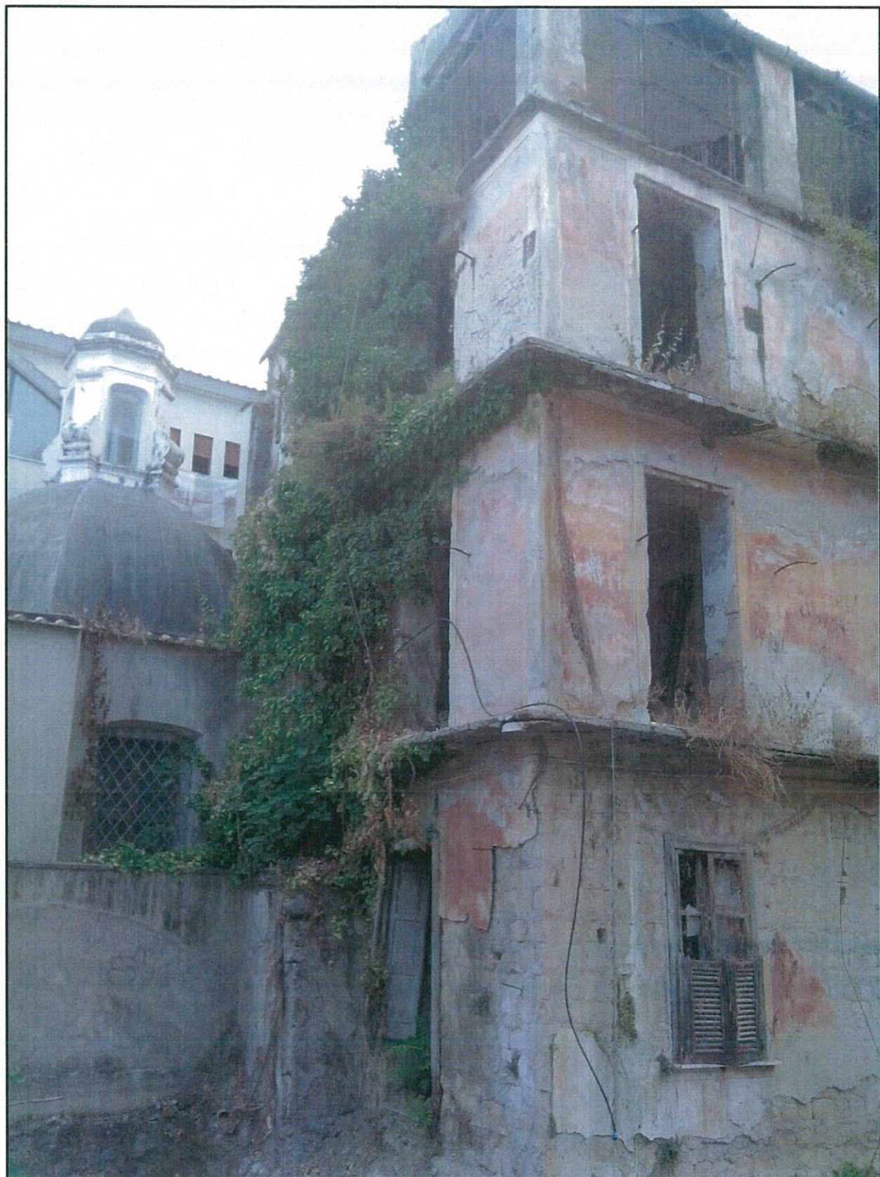
STATO DI FATTO – VISTA DAL CORTILE