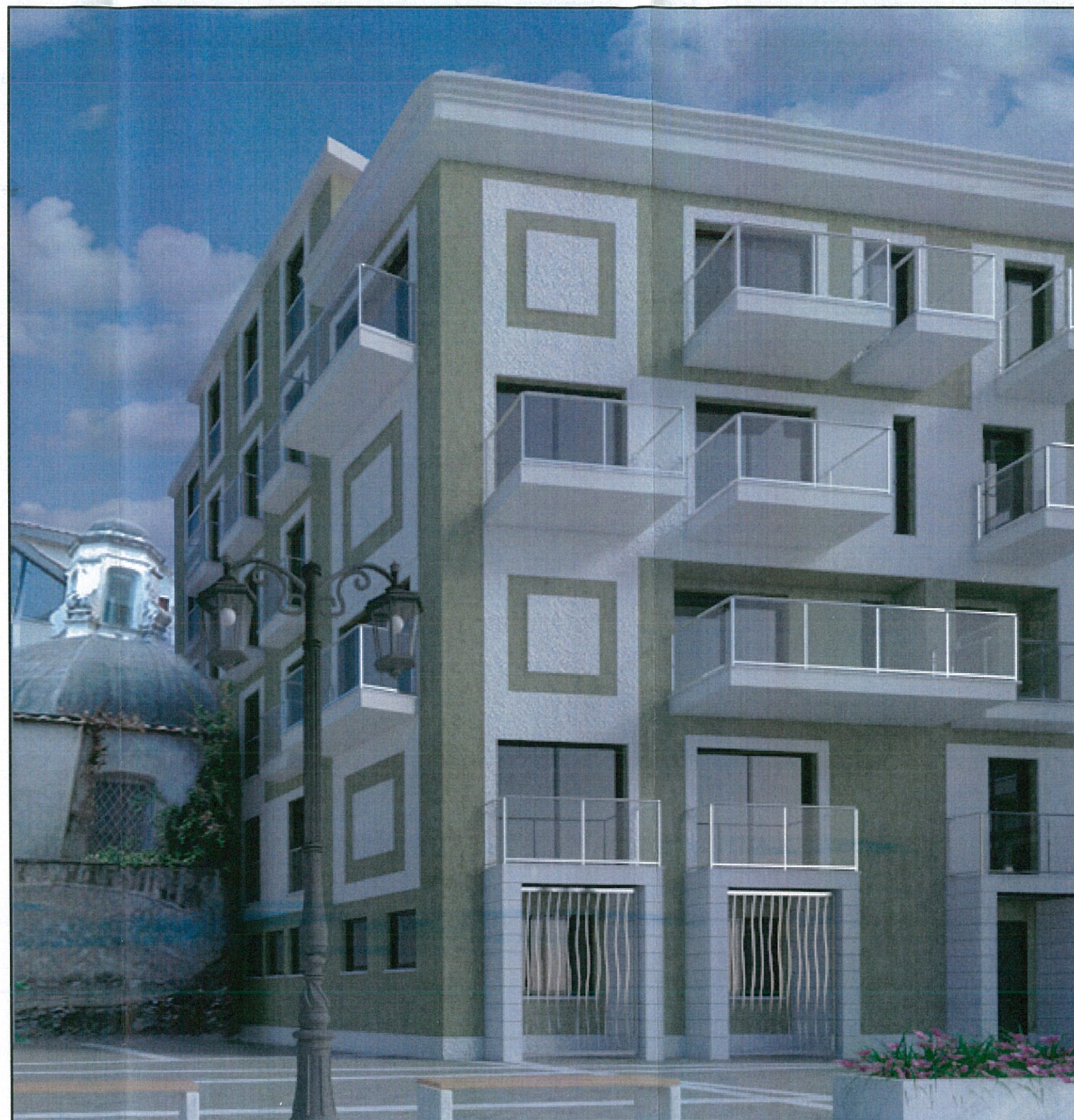
FOTOINSERIMENTO DI PROGETTO – VISTA DAL CORTILE