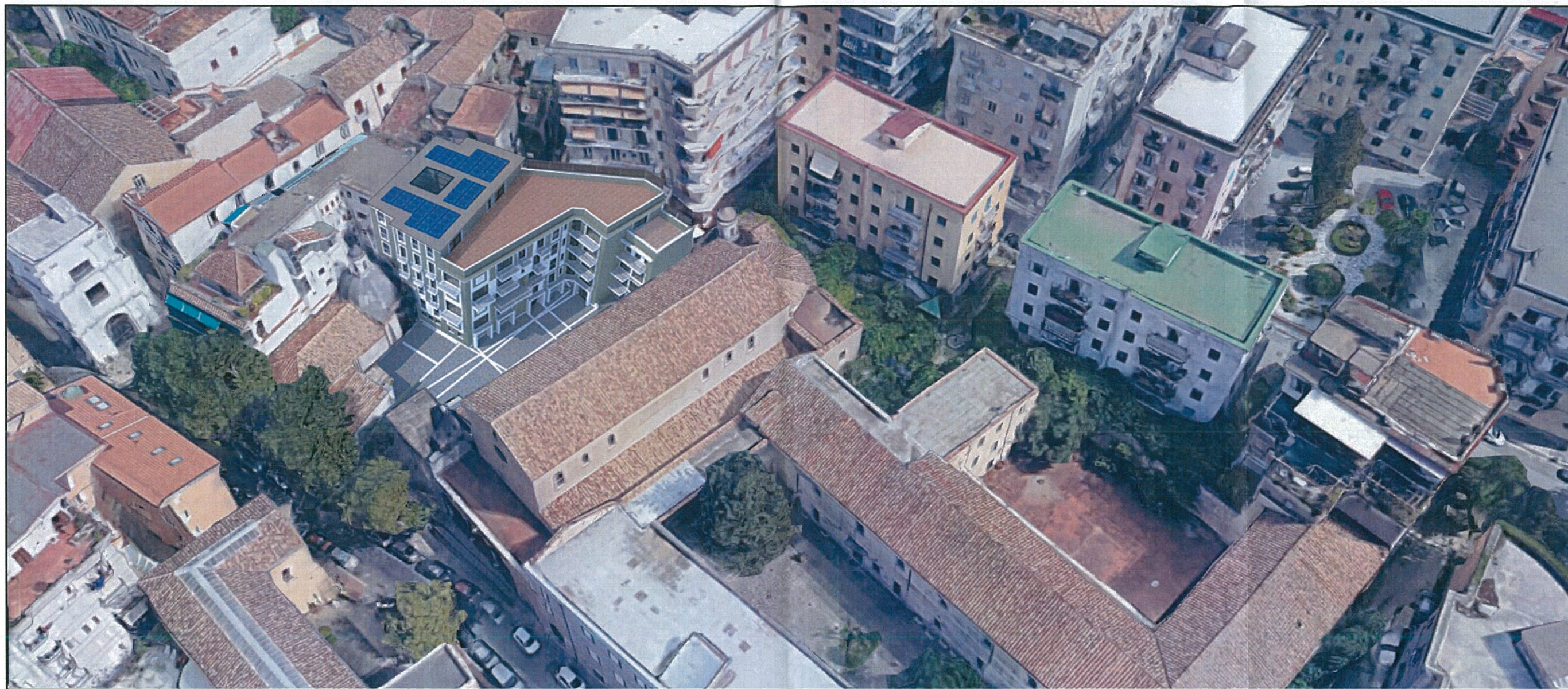
FOTOINSERIMENTO DI PROGETTO – VISTA DALL'ALTO