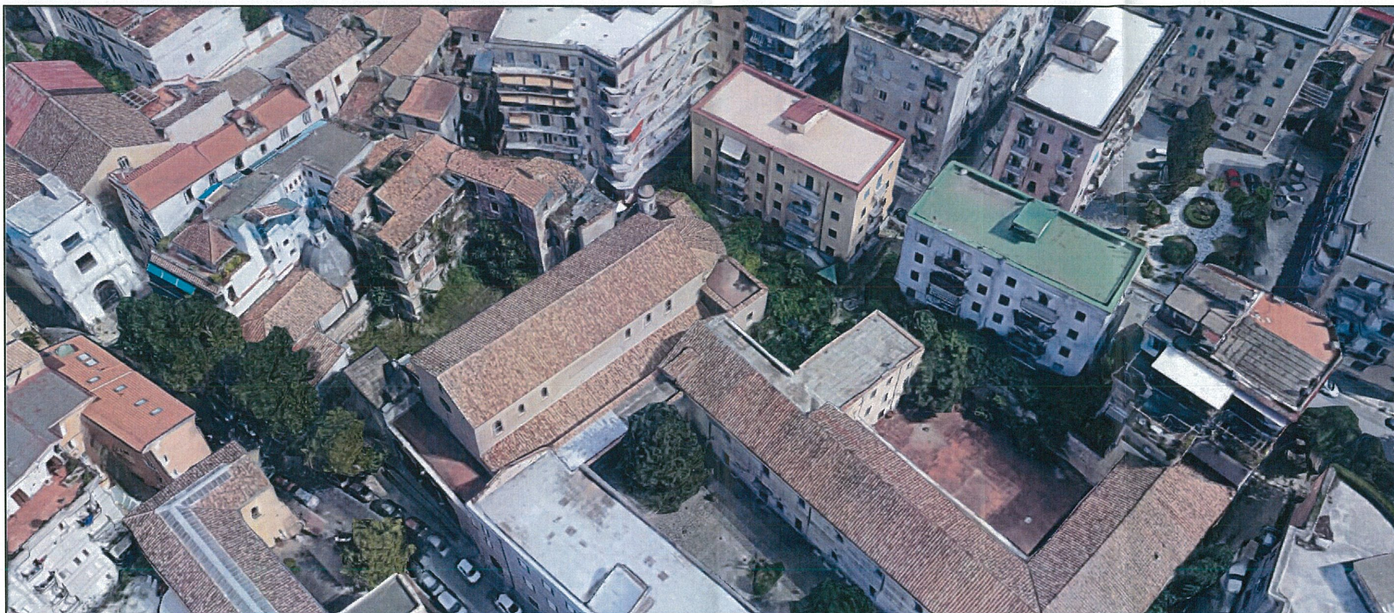
STATO DI FATTO – VISTA DALL'ALTO