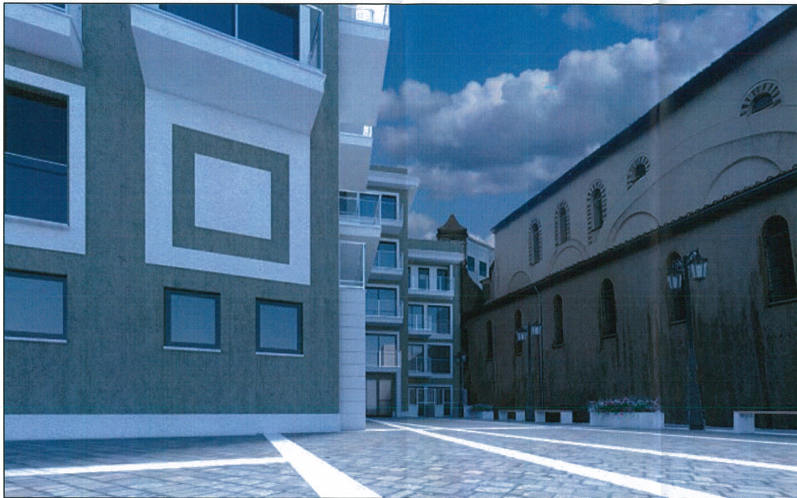
FOTOINSERIMENTO DI PROGETTO – VISTA DAL VERSANTE SUD DEL CORTILE