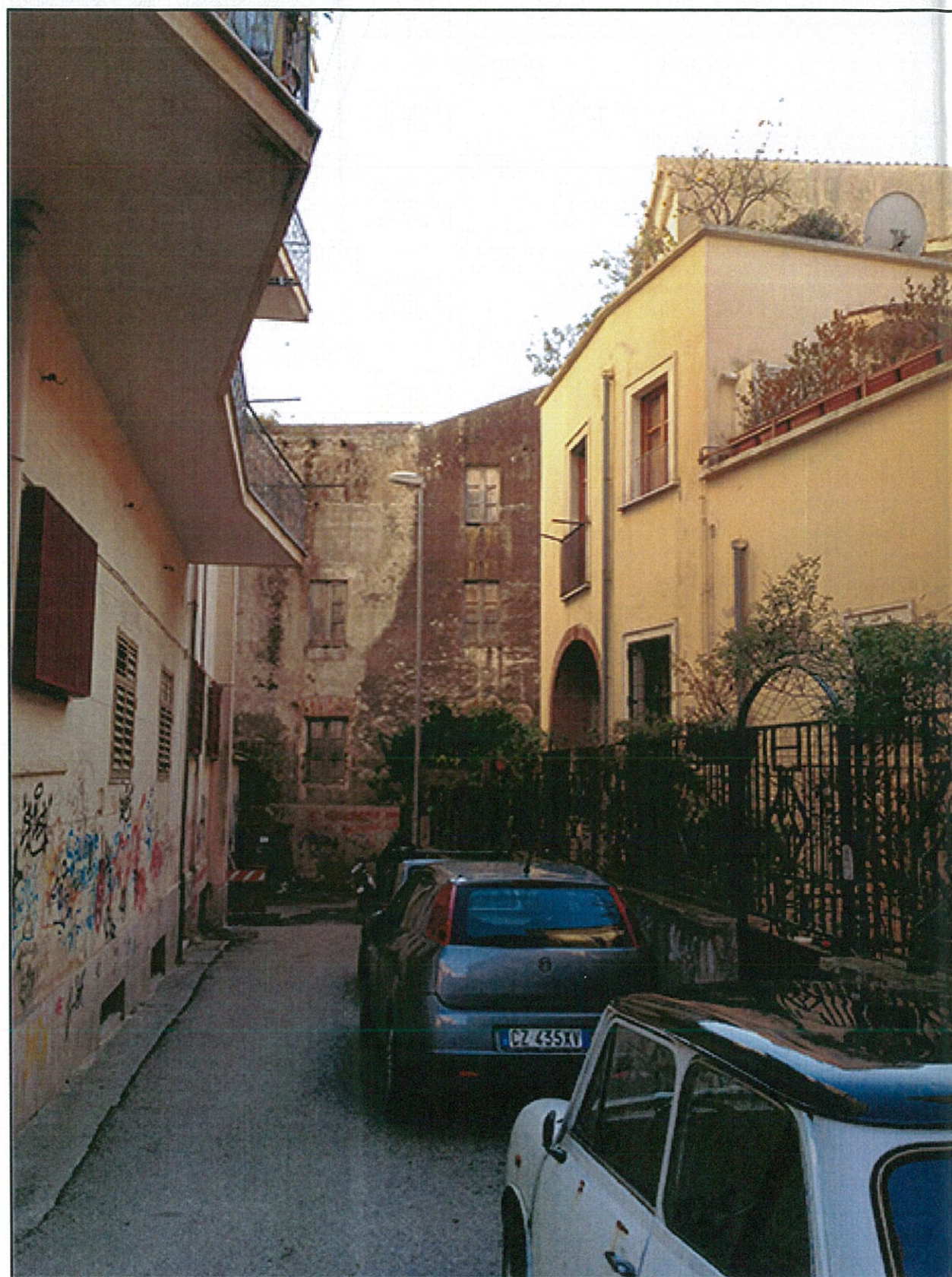
STATO DI FATTO – VISTA DA VIA CAPONE