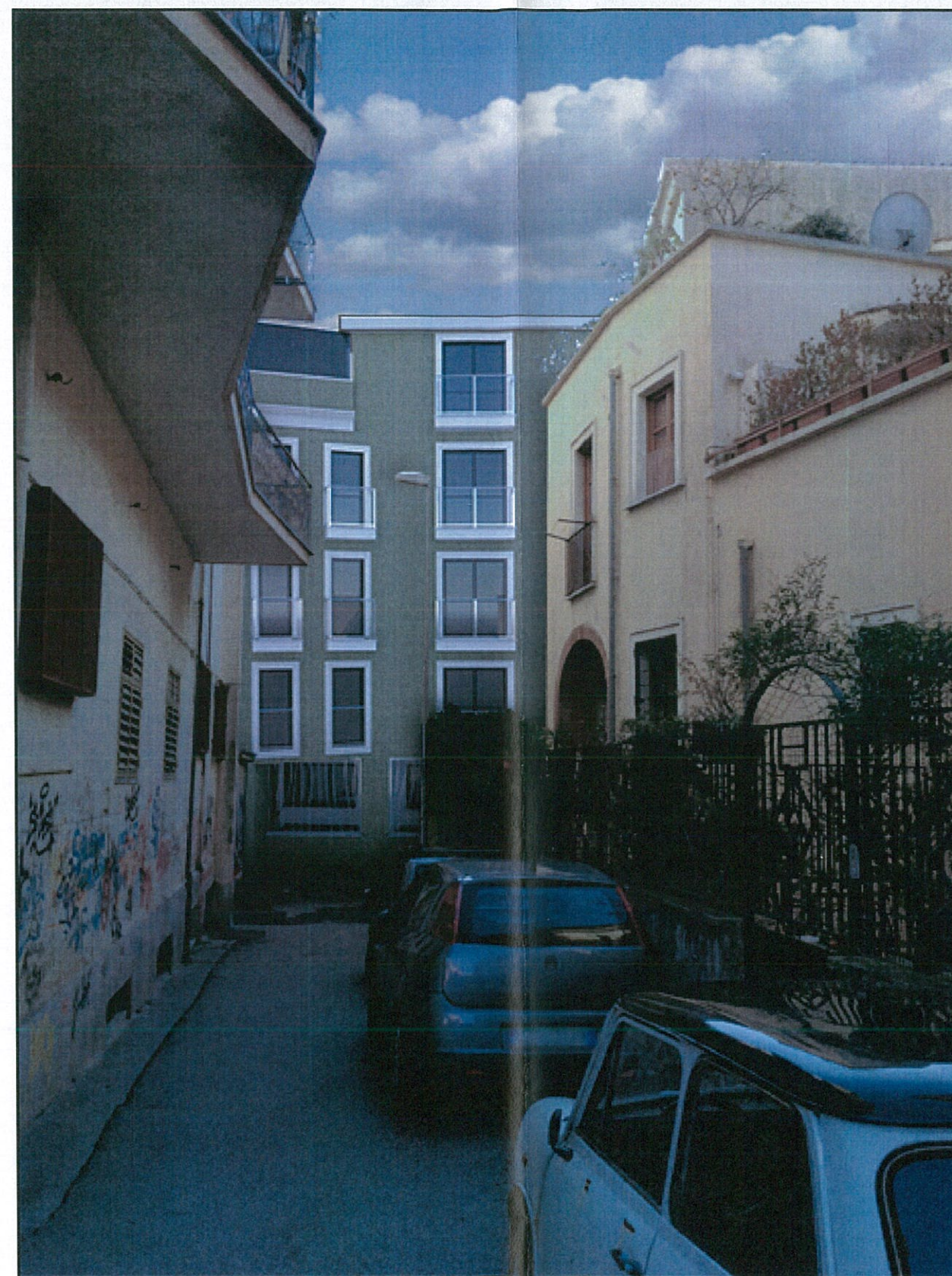
FOTOINSERIMENTO DI PROGETTO – VISTA DA VIA CAPONE