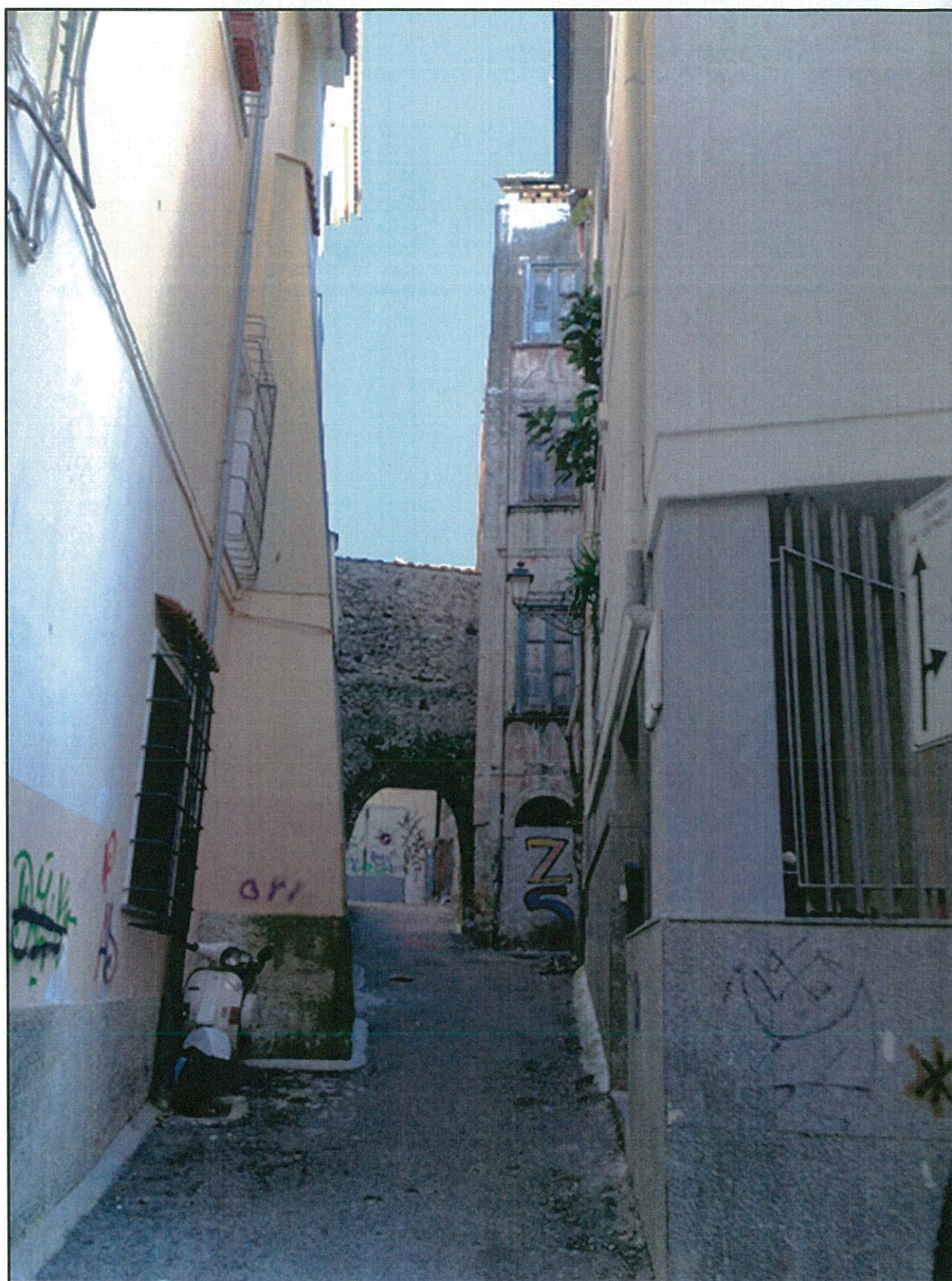
STATO DI FATTO – VISTA DA VIA CAPONE