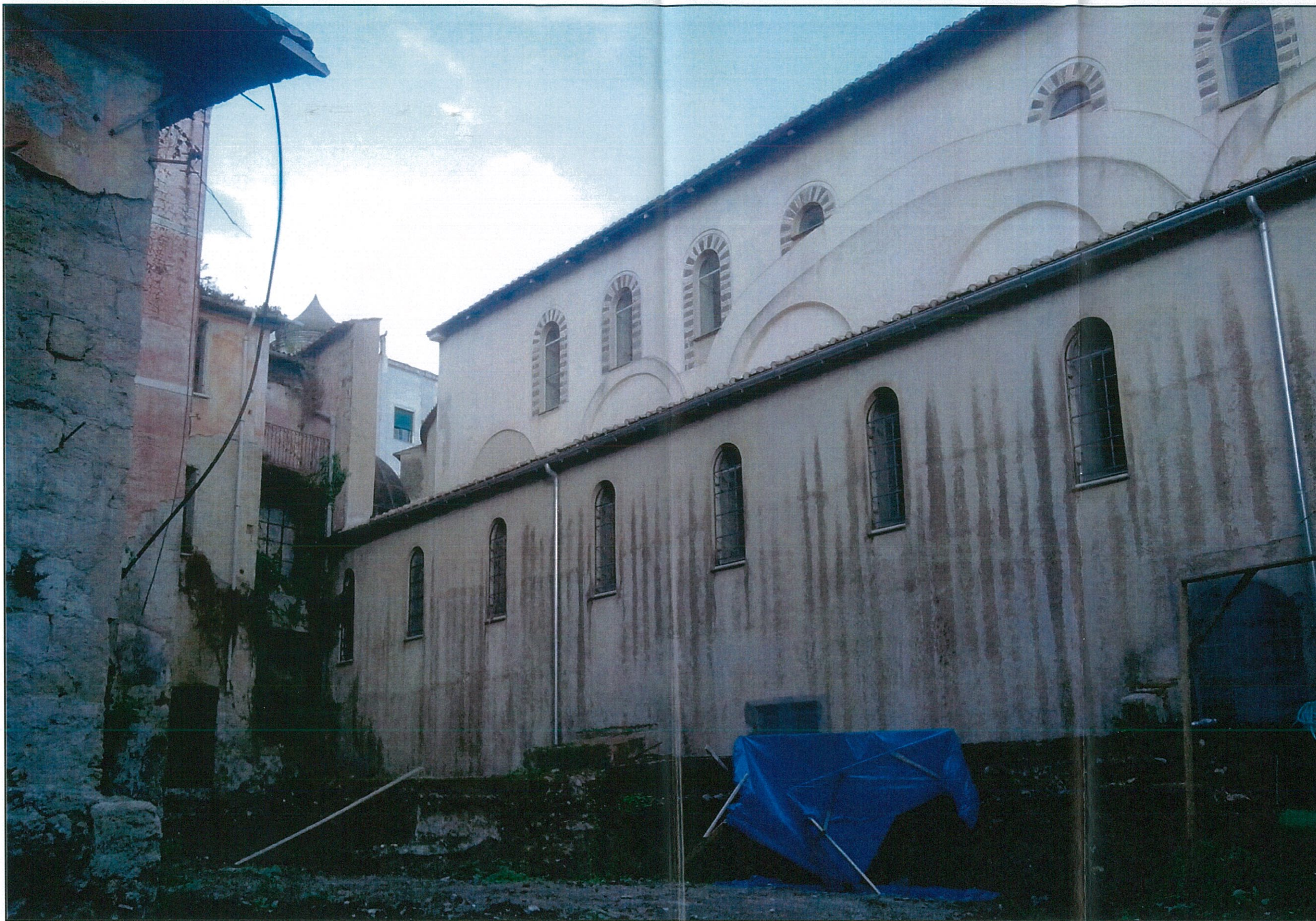
STATO DI FATTO – VISTA DAL VERSANTE SUD DEL CORTILE