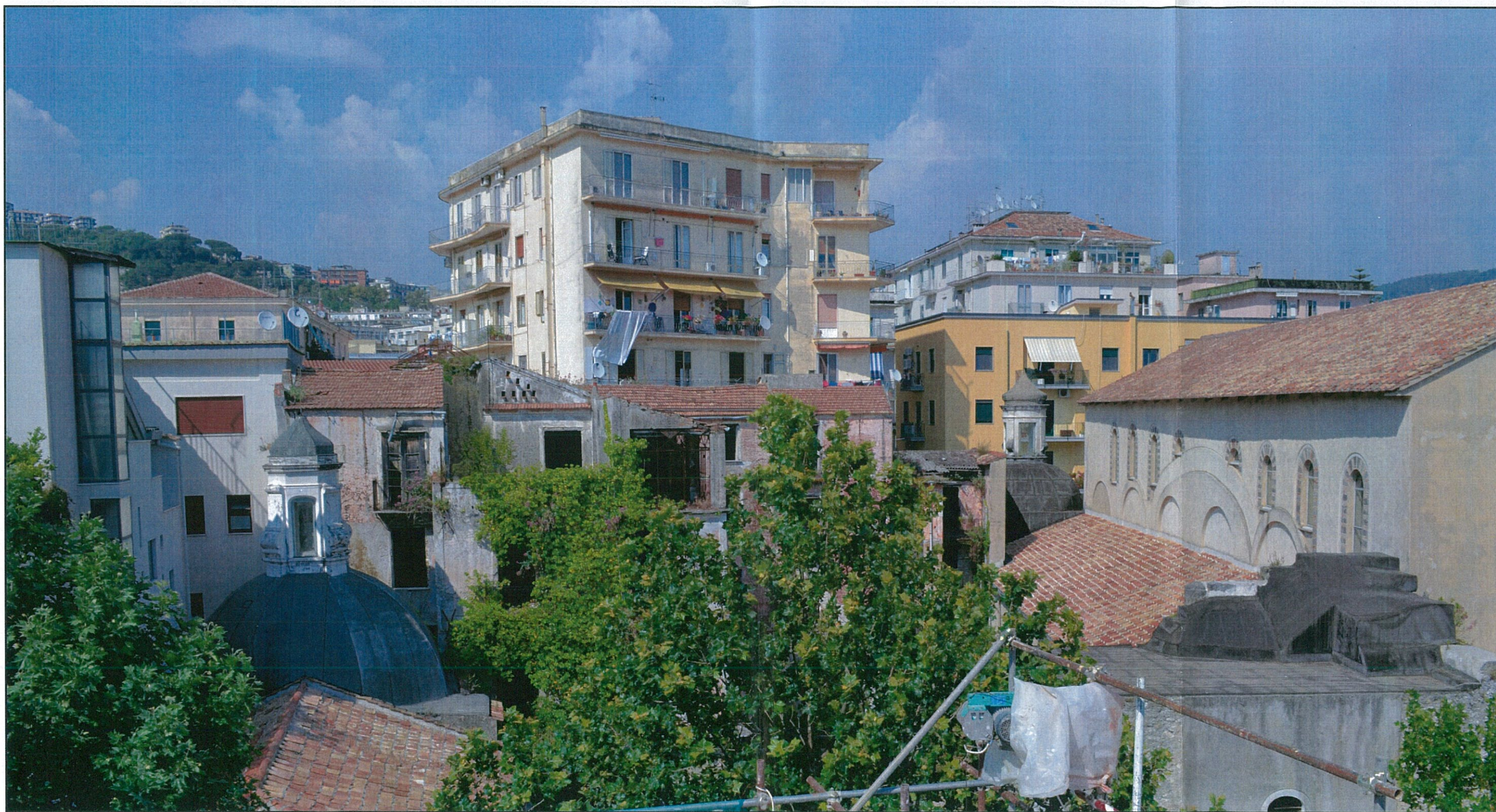
STATO DI FATTO – VISTA DALL'ALTO DA VIA SAN BENEDETTO