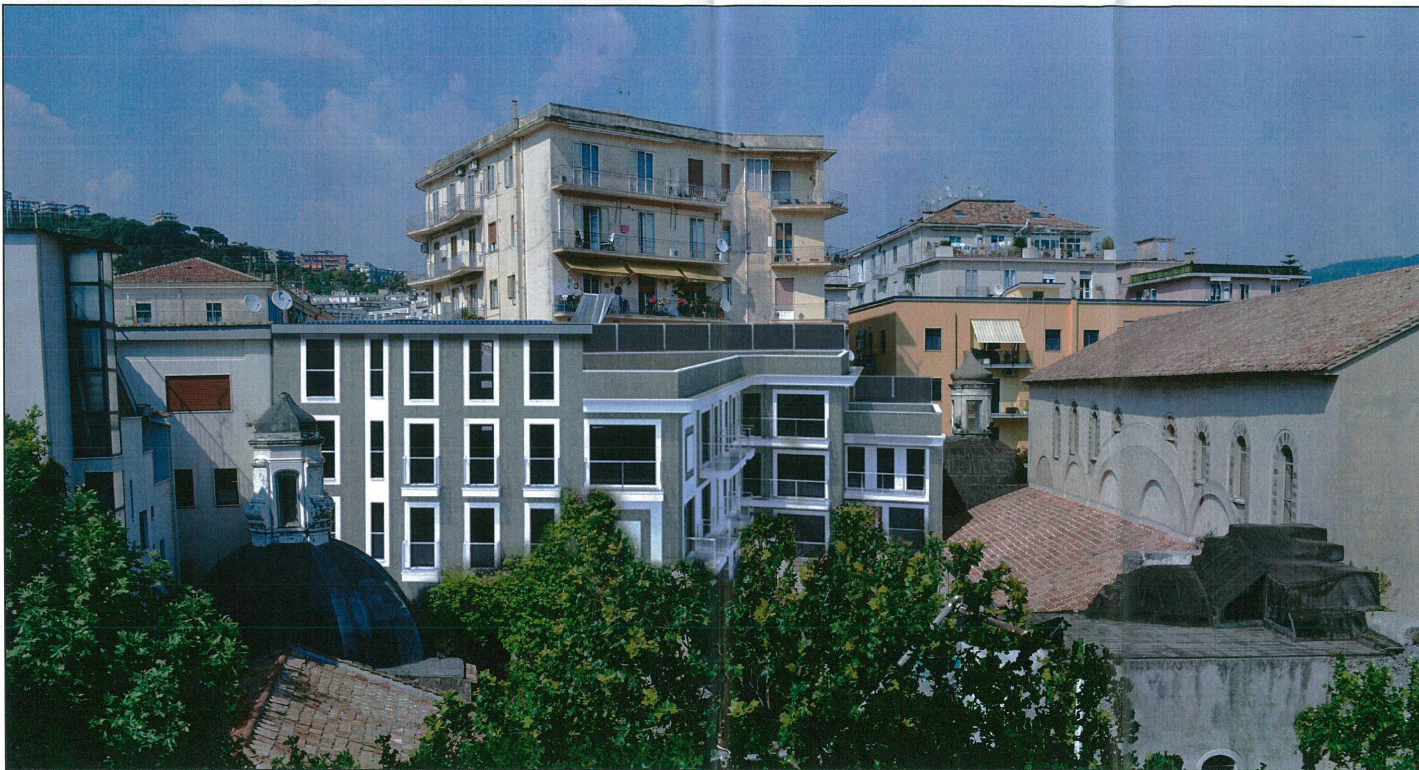
FOTOINSERIMENTO DI PROGETTO – VISTA DALL'ALTO DA VIA SAN BENEDETTO